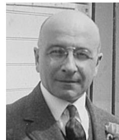
francouzský chirurg a biolog Alexis Carrel (1873-1944)

Udržet naživu rostlinné nebo živočišné buňky odebrané z živého organismu se ještě koncem 19. století zdálo zcela nemožné. Přesto první úspěšné pokusy proběhly už počátkem 20. století. První, kdo dokázal, že orgány či tkáně je možné dlouhodobě udržet naživu i po vyjmutí z organismu, byl francouzský lékař a laureát Nobelovy ceny Alexis Carrel (1873–1944). Nezbytné je zajištění optimálních podmínek pro rozmnožování. V roce 1912 udělal pokus, ve kterém vložil do živného roztoku kus kuřecího srdce, jehož buňky vydržely v kultivační nádobě po plných 27 let. Tento pokus způsobil průlom v rané historii biologie a měl význam pro rozvinutí metod genetických, mikrobiologických a farmaceutických. Carrel se nesprávně domníval, že lze kultivovat libovolné buňky neomezeně dlouho. Ve skutečnosti je schopnost buněk dělit se omezena tzv. Hayflickovým limitem.