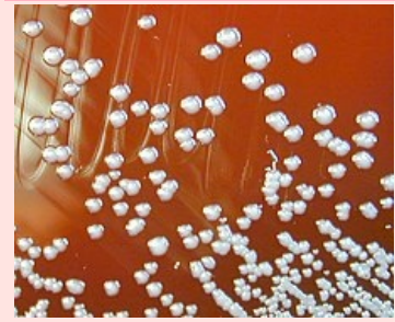
Kolonie Burkholderia pseudomallei na krevním agaru