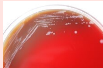
Kolonie Burkholderia mallei na krevním agaru