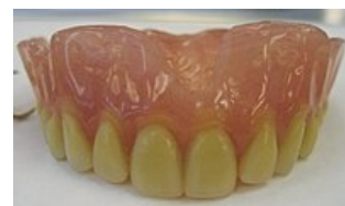
Celková zubní náhrada horní čelisti