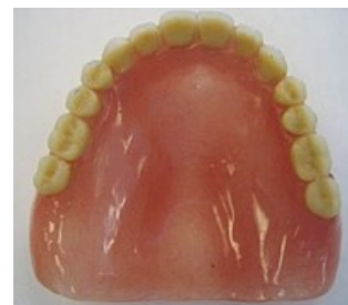
Celková zubní náhrada horní čelisti (pohled zdola)