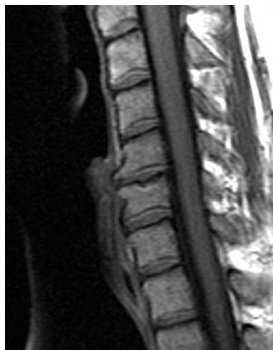
T1 vážený obraz sagitální řez krční páteře s degenerací disku, osteofyty a osteoartrózou C5-C6

Statickými faktory se myslí například prosté zúžení kanálů kvůli osteofytům. Dynamické faktory přímo navazují na statické faktory. Vlivem pohybu míchy ve zúženém páteřním kanálu dochází k iritaci nervové tkáň. Při anteflexi páteře dochází k iritaci míchy osteofyty ventrální části kanálu. Při retroflexi páteře se vyklenuje do páteřního kanálu hypertrofické ligamentum flavum, které stlačuje míchu vůči osteofytům vytvořených dorsálně (dors. na obr. tělech). Ischemie pravděpodobně hraje roli v obrazu SCM. Histopatologicky byly v případech SCM prokázány změny v šedé hmotě, přičemž bílá hmota zůstala zachována. To se vyskytuje u ischemie, která v tomto případě vzniká pravděpodobně následkem poruchy mikrocirkulace. Vlivem zúžení páteřního kanálu a abnormálních pohybů nervových struktur v páteřním kanále u pacientů s SCM může dojít k poranění nervových struktur vlivem napínacích a střížných sil a způsobit lokální axonální poškození. [3]