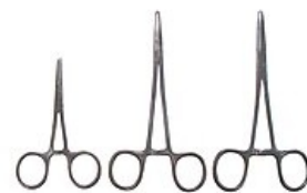
Cévní svorky – Pean