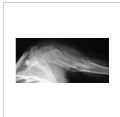
Ollierova choroba – Mnohotné enchondromy ve proximálním humeru

Zvláštním nádorem z chrupavčité tkáně je chondrohamartom . Vzniká typicky subpleurálně v plicích z odštěpených kmenových buněk nezapojených do okolní tkáně (hamarcie). Mikroskopicky jej tvoří dobře diferencovaná chrupavčitá tkáň s komůrkovými buňkami, na periferii je příměs dalších tkání (respirační epitel, hladká svalovina, tuková tkáň). Nádor je řazen mezi benigní, avšak s určitým rizikem malignizace.