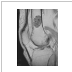
Enchondrom femuru MRI