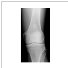
Enchondrom femuru RTG