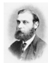
Walther Flemming (1843–1905)