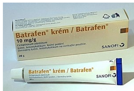
Batrafen® krém, hromadně vyráběný léčivý přípravek s ciklopiroxiem