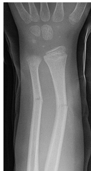
Zlomenina typu vrbového proutku – RTG