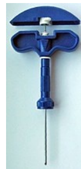
Jehla používaná při odběru kostní dřeně z pánevních kostí