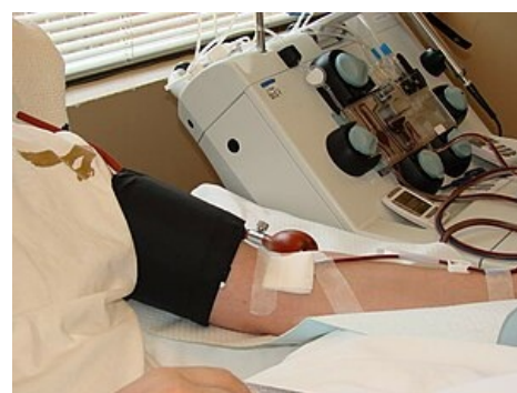
Odběr "nastimulovaných" kmenových buněk ze žíly pomocí separátoru