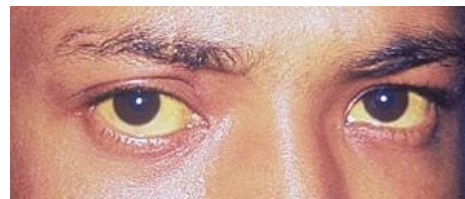
Ikterické zbarvení sklér