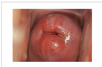
Ektropium při kolposkopii

Při kolposkopii sledujeme sytě červené okrsky s tendencí k lehkému krvácení. Ektropium může být způsobeno hormonálními změnami, zánětem nebo traumatizací (např. po porodu). Tyto léze můžou být lehce zaměnitelné za nádorový proces. Nález ektopia je fyziologický u multipar. U nulipar mluvíme o ektopii .