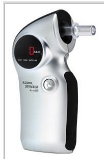
Alkohol tester [online]. [cit. 2010-02-09]. < http://alkohol-tester.cz/ >.

Dechové analyzátoři alkoholu prošly rozsáhlým vývojem. Moderní přístroje lze velmi přesně kalibrovat, jejich senzory mají vynikající stabilitu v čase atd. Kontrolují také objem vzorku odebraného ke stanovení, aby měření proběhlo ve vzduchu vydechovaném z plicních alveolů (a nikoliv např. z horních dýchacích cest) a výsledky tak odpovídaly koncentraci alkoholu v krvi.