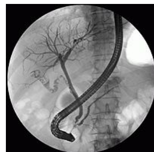
ERCP – rentgenový snímek