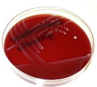
Enterococcus faecalis na KA