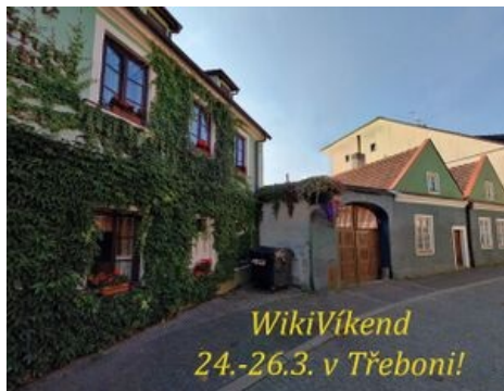
40. WikiVíkend se bude konat v Třeboni v termínu 24.-26.3.2023 .