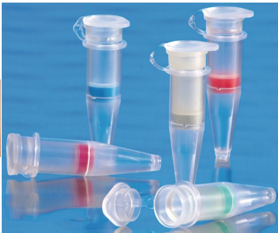
Centrifugační filtr (obrázek z [1] )