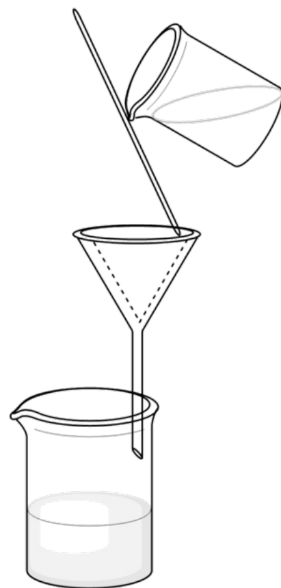
Filtrace přes papírový filtr

Podtlaková filtrace je naproti tomu založena na odsávání filtrátu. V klasickém uspořádání se filtrační membrána pokládá na Büchnerovu nálevku, která je připojena přes odsávací baňku k vakuu. Komerčně jsou dnes dostupné jednorázové filtrační jednotky pro podtlakovou filtraci vyrobené z vhodného plastu.