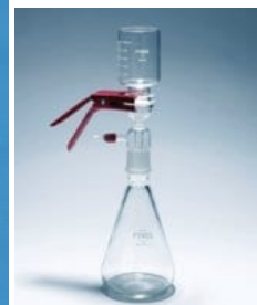
Vakuová filtrace (obrázek z [2] )