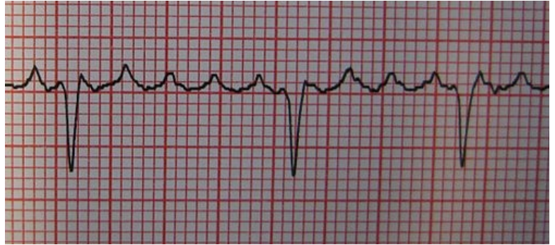
Typický flutter síní s funkčním AV blokem 3:1 až 4:1