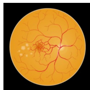
Obraz očního pozadí s makulární degenerací, která je způsobena hromaděním produktů metabolismu, a způsobuje tak postižení žluté skvrny