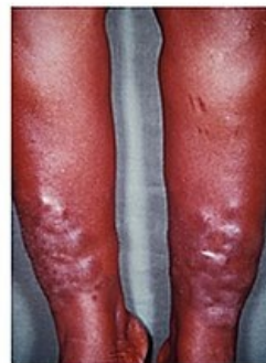
Akropachie na rukou a pretibiální myxedém