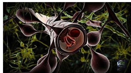
Obr. 2: Mozková kapilára s astrocyty typu 1