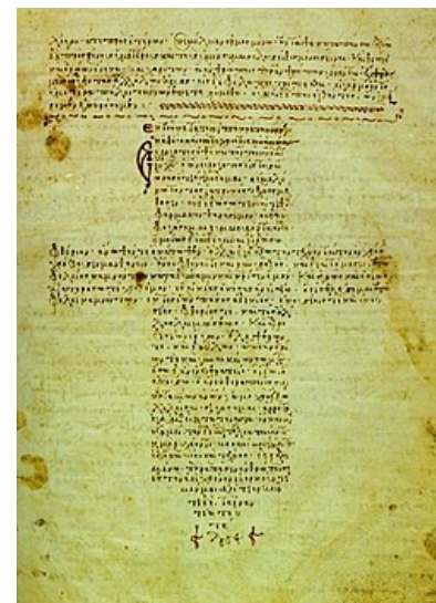
Manuskript přísahy z 12. století