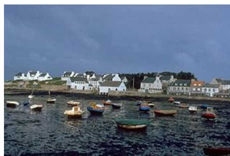
Znečištění vody ropou