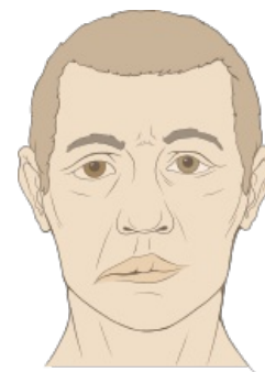
Bellova obrna: pokleslý koutek, vyhlazená nasolabiální rýha, neschopnost sraštit čelo