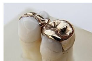
Kovová inlay (vlevo), overlay (vpravo)

Laboratorně zhotovené výplně pro kavity nejčastěji I. a II. třídy podle Blacka.