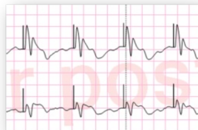
Záchyt s tvorbou vln T