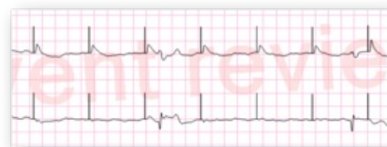
Při stimulačních výbojích se mohou objevovat záškuby, ale nevidíme tvorbu vln T

V PNP většinou používáme fix rate, nastavení on demand je méně časté. Frekvence se nastavuje cca 70/min. Použijeme nízký stimulační proud 20 mA a postupně zvyšujeme proud až dojde k záchytu. Ideální je palpat stehenní tepny, protože záškuby svalstva na krku mohou komplikovat palpaci karotid. K záchytu dochází obvykle při proudu 50-100 mA. Při dosažení maxima proudu přístroje bez záchytu je nutné změnit uložení elektrod.