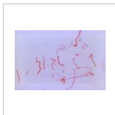
Prevotella melani... 700 × 460; 32 KB