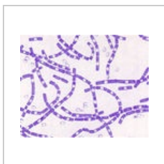
B.anthraxis1.jpg 308 × 246; 63 KB

The following 3 files are in this category, out of 3 total.