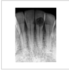
Granuloma inter... 300 × 398; 35 KB