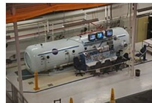
Dekompresní komora v NASA

Jedná se o stav z poruchy dekomprese vlivem Henryho zákona . Jelikož je dusík nejhojněji zastoupeným plynem v atmosféře, rozpouští se ho značné množství v těle potápěčů (nejčastěji v tělních tekutinách, dále v tkáních, tukové jsou zvlášť náchylné lipidech). Vlivem příliš rychlé dekomprese (poklesu tlaku) se tento dusík opět přemění v plynné skupenství a začne vytvářet bublinky , zejména ve venozní krvi. Nastávají bolesti kloubů a svalů, svalové obrny a ztráty vědomí. Nejzávažnější komplikací je embólie bučkami v plicích či koronárních cévách.