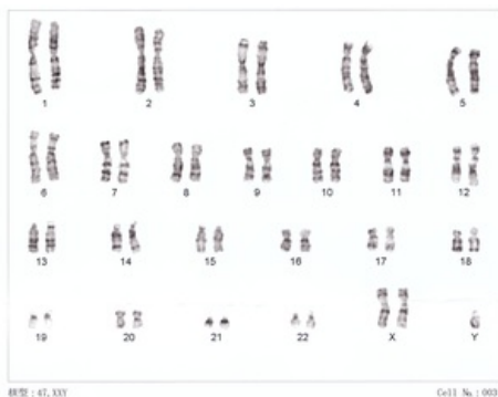
Karyotyp pacienta s Klinefelterovým syndromem (47,XXY)

MedlinePlus 000382 ( https://medlineplus.gov/ency/article/000382.htm )