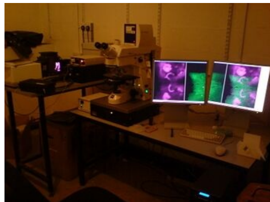
Fotografie konfokálního mikroskopu v zatemněné místnosti. Kontrastnější fotografii konfokálního mikroskopu naleznete například zde [1] ( https://www.ljmu.ac.uk/GERI/CEORG/Images/CONF1.jpg )