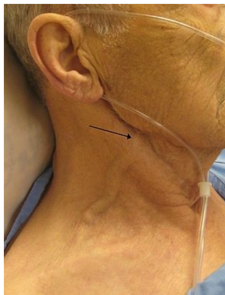
Městnání v krčních žílách