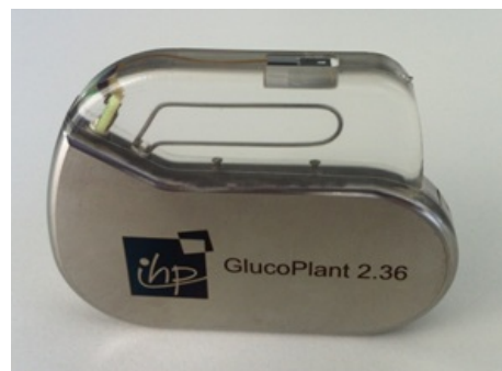
Senzor pro kontinuální měření glykemie.

Elektroda ve formě drátku potažená vrstvou enzymu a ochrannou vrstvou je trvale zavedena v podkoží pod úhlem 45° nebo 90°. Měření je stejné jako u selfmonitoringu glykemie (SMBG) založeno na elektrochemickém principu, tedy glukózo-oxidázové metodě. Systém se musí kalibrovat podle SMBG (nejlépe v momentě stabilní glykemie). Životnost elektrody kolísá od 7 do 30 dnů v závislosti na její biokompatibilitě. Z celého systému je právě elektroda nejnáročnější částí na výrobu, ceny se pohybují okolo jednoho tisíce až 1700 Kč. Transmitter se dá pořídit za 10 000 Kč a receiver za 13 000 Kč.