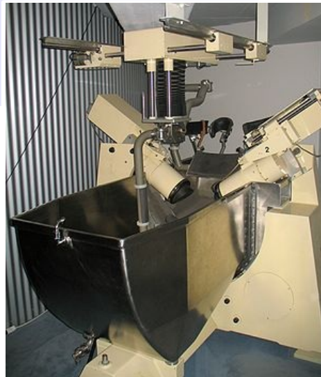
Historicky první komerčně dostupný litotryptor Dornier HM1