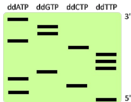
Sangerova metoda sekvenování, 5'TACAGTTTCAGGA3'