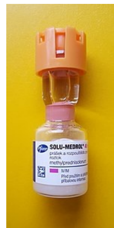
lahvička 40mg methylprednisolonu