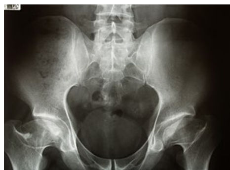
Bilaterální avaskulární nekróza hlavice femuru