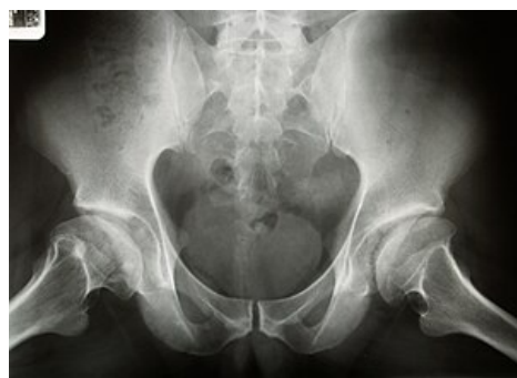
Bilaterální avaskulární nekróza hlavice femuru