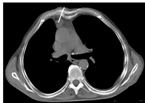
Biopsie thymomu pod CT kontrolou