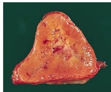
Paragangliom v řezu