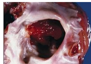
Srdeční myxom: gelatinózní tumor téměř zcela vyplňující levou síň.