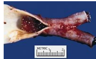
Embolus srdečního myxomu v bifurkaci aa. iliaca communes