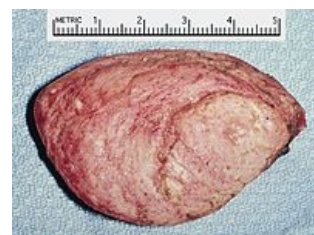
Srdeční rhabdomyom v pravé komoře u tříleté dívky navenek se prezentující srdečním šelestem.