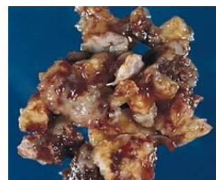
Srdeční myxom: 71-letý muž hospitalizovaný pro TIA; transezofageální echokardiografie ukázala srdeční myxom v levé síni.