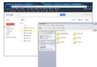
Jak vidíte, na Google disku i v počítači jsou stejné složky

Google disk je nástroj, který umožňuje snadnou správu Google dokumentů. Pokud se rozhodnete Google disk si založit, software, který si nainstalujete vytrhne z vašeho pevného disku 5 GB dat a ta nahraje na internet - do toho výše zmíněného cloudu. Tato operace způsobí, že se ke svým nejdůležitějším datům dostanete z jakéhokoli počítače připojeného k internetu.