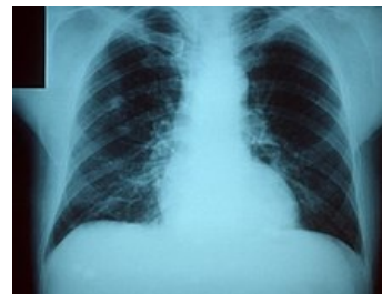
Pneumonie – skiagram hrudníku

[[Soubor:Pneumonia x ray.jpg | thumb | 220px | Pneumonie – skiagram hrudníku]] .