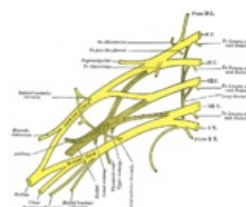
Schéma plexus brachialis