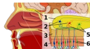
1. Bulbus olfactorius 2. Mitrální buňky 3. Lamina cribrosa 4. Sliznice nosní dutiny 5. Synapse 6. Fila olfactoria