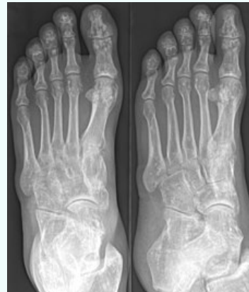
RTG obraz osteopoikilózy na chodidle

Osteochondrodysplasiae aliae, specificatae