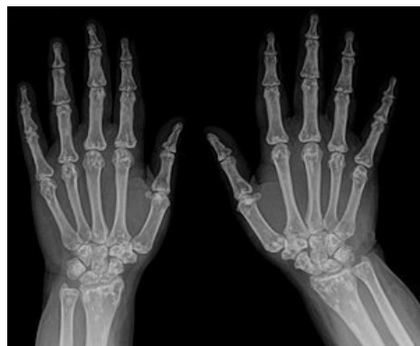
Osteopoikilóza skeletu ruky.

OMIM 166700 ( https://omim.org/entry/166700 )