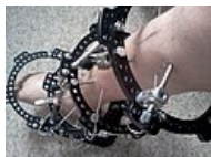
Zevní fixační systém navržený Taylorem, vícerořadný