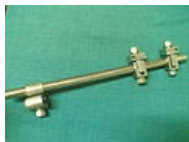
Zevní fixátor jednorovinný