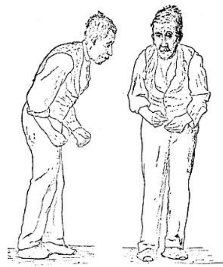
Náčrt postoje nemocného