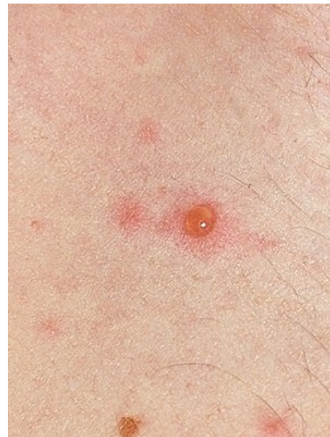
Puchýř neštovic – časná stádium