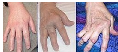
Revmatoidní artritida ruky