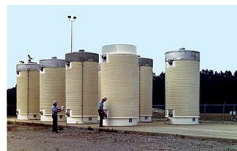
Suchý způsob skladování radioaktivního odpadu