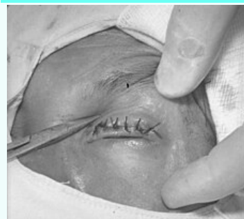
Entropium a trichiazie způsobené trachomem.